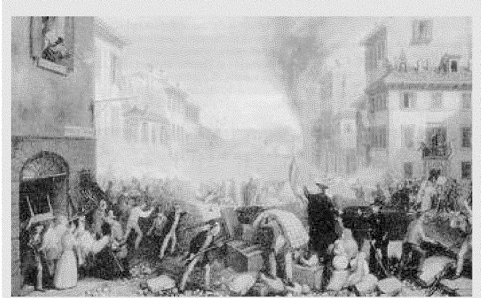
Nel 1848 la principessa di Belgioioso partecipò alle Cinque giornate di Milano